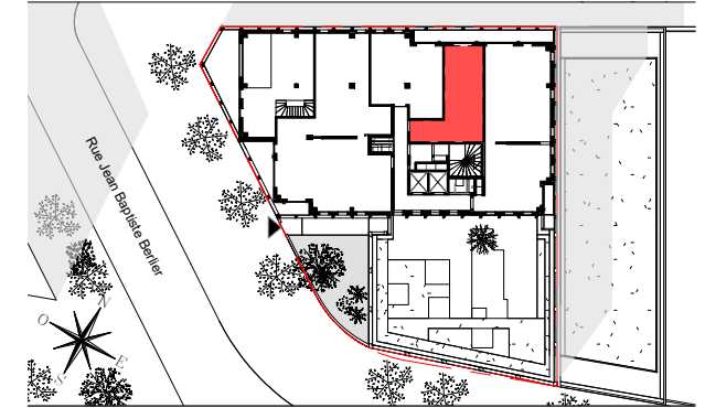
STUDIO n°1094 au 9ème étage